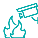
Antincendio & sicurezza