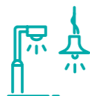
Illuminazione interna ed esterna